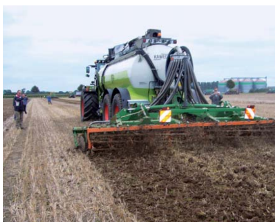
Emissionsmindernde Ausbringtechnik für Wirtschaftsdünger