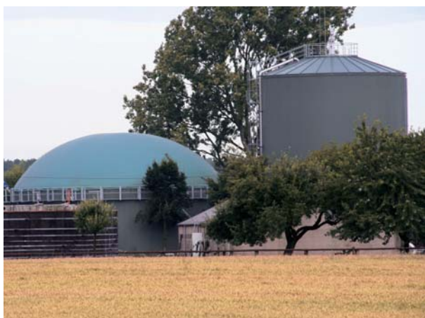
Energetische Gülleenutzung in Biogasanlagen

In der Tierhaltung bestehen folgende Ansatzpunkte zur Reduzierung von Treibhausgasemissionen.