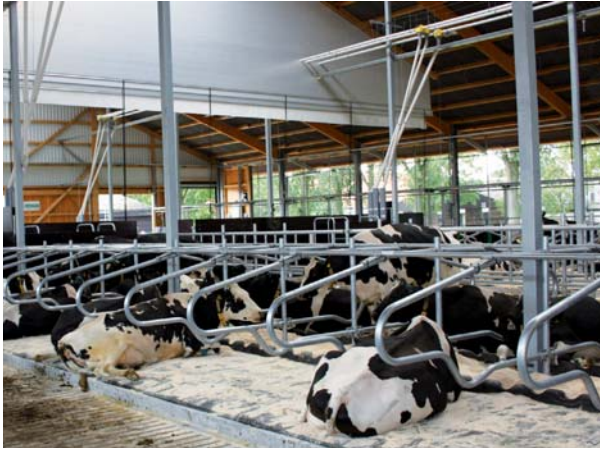
Frei gelüfteter Außenklimastall