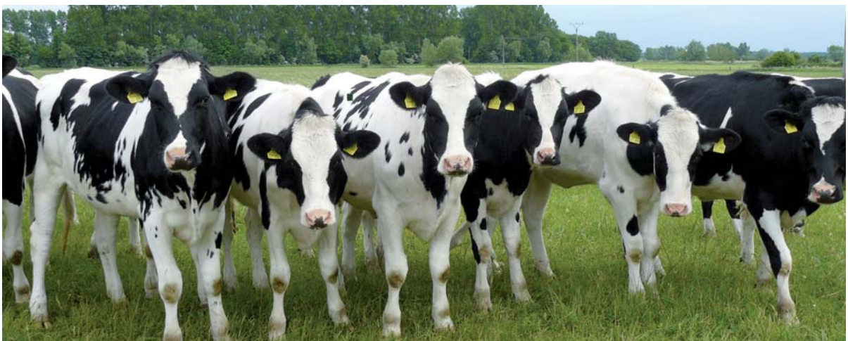
Zeitlich angepasster Teilweidegang von Jungrindern