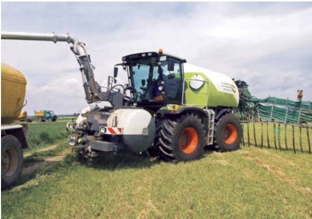
Grünland: Emissionsmindernde Ausbringtechnik

Die Tierhaltung in Deutschland wird aufgrund der Feststellung und Bewertung der Zusammenhänge und Ursachen durch den Klimawandel in unterschiedlichem Maße betroffen sein. Bei den Anpassungsstrategien innerhalb der Produktionsverfahren sind tierartspezifische und regionale Aspekte zu beachten, die zu flexiblen und abgestuften Anpassungsstrategien führen.