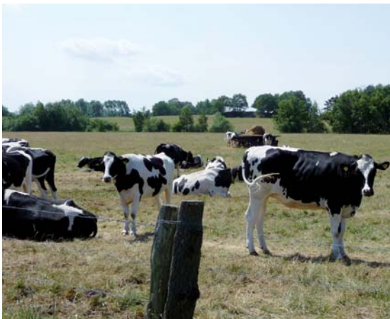
Hitze- und Trockenstress für Tier und für Grünland

Die nach bisherigem Kenntnisstand – auf der Grundlage aktueller jedoch mit teilweise erheblichen Unsicherheiten behafteter Klimaprognosen – erwarteten und zum Teil bereits eingetretenen, regional unterschiedlichen Auswirkungen des Klimawandels wie Temperaturanstieg, Zunahme extremer Wetterereignisse (Zunahme der Frequenz schwerer Niederschlagsereignisse und intensiver, längerer Trockenperioden) und die Verschiebung der Niederschlagsverteilung (saisonal und regional) auf die einzelnen Bereiche der Tierhaltung lassen sich wie folgt exemplarisch zusammenfassen.