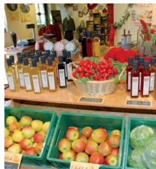
Bauernhofcafés und Hofläden als Beispiele für Diversifizierung

Die im Rahmen der Ländlichen Entwicklungsprogramme angebotenen Fördermaßnahmen werden föderal vielfältig über verschiedene Bewilligungsstellen abgewickelt: Neben Bezirksregierungen, Ämtern für Landentwicklung und Landesbetrieben übernehmen auch Landwirtschaftskammern hierbei wesentliche Aufgaben. In zahlreichen Maßnahmen sind Landwirtschaftskammern als beratende, Antrag annehmende und bewilligende Behörden mit Prüfauftrag tätig. Eine der Landwirtschaftskammern führt im Auftrag des Landes die Auszahlung der Fördermittel durch, andere sind Dienstleister mit einem spezifischen Arbeitsauftrag.