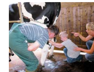
Wo kommt die Milch her?

Bauernhöfe sind ideale Lernorte, um die Erzeugung von Nahrungsmitteln mit allen Sinnen zu erkunden. Gefördert werden landwirtschaftliche Betriebe, die diese Bildungsangebote für Schulen und Kindergärten durchführen. Umsetzungspartner sind Kreisbauern- oder Landfrauenverbände sowie regionale Bildungsträger aus Landwirtschaft und Umwelt. Das direkte Miterleben der landwirtschaftlichen Produktion vermittelt anschaulich wie und wo Lebensmittel entstehen. Kochen mit Kindern, Wo kommt unsere Milch her?, Wie wird Getreide erzeugt und verarbeitet sowie Welche Zukunft hat die Landwirtschaft? sind Modelle für handlungsorientiertes Lernen. Die Landwirtschaftskammern sind bei dieser Maßnahme Bewilligungsstelle und Beratungspartner.